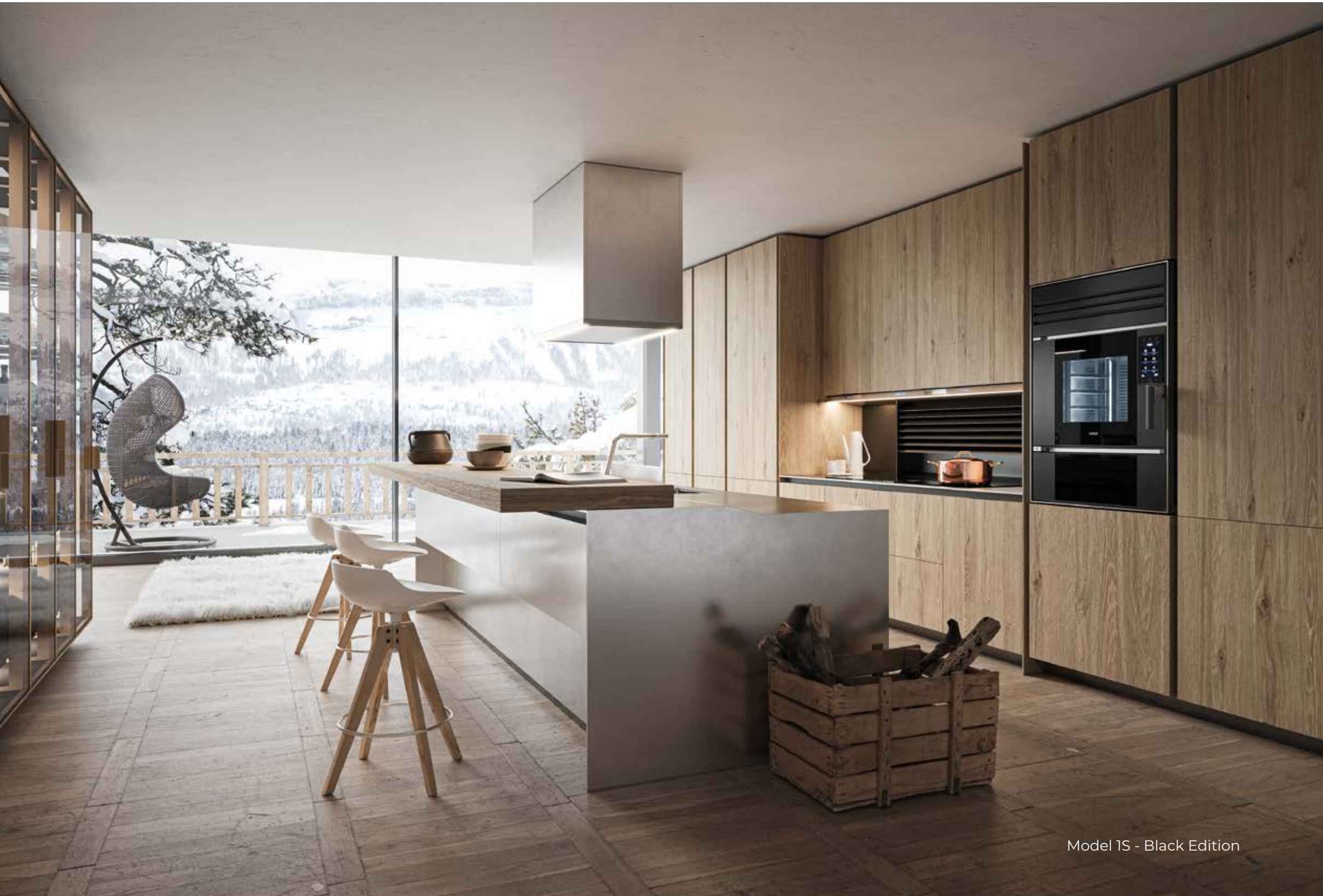
Model 1S - Black Edition