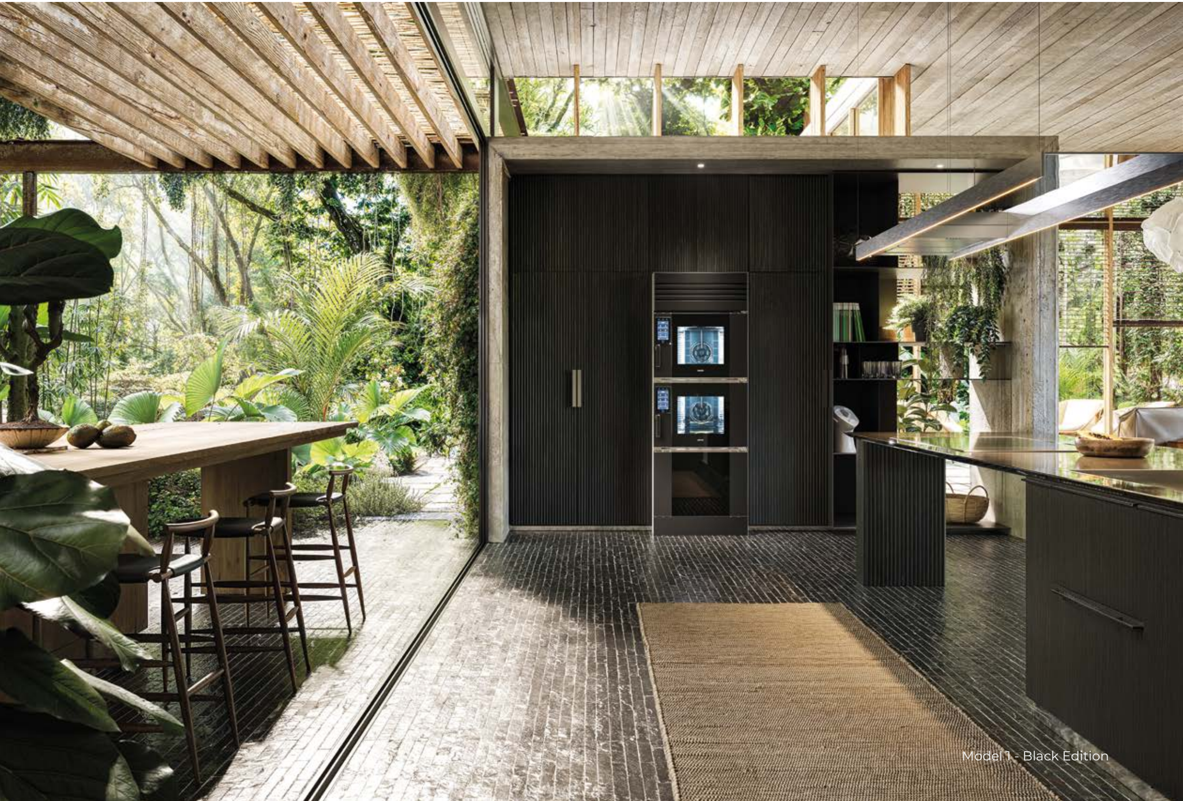
Model 1 - Black Edition

Realizzati interamente in acciaio inox, SuperOven Model 1 e Model 1S sono disponibili in due finiture: satinato e nero opaco.