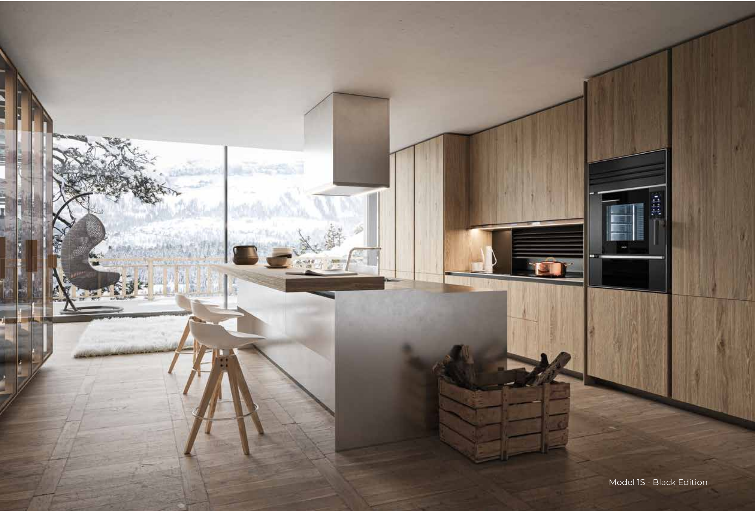
Model 1S - Black Edition